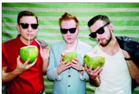
Two Door Cinema Club - descargar