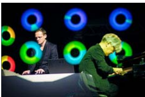
Alva Noto &amp; Ryuichi Sakamoto

James Blake – LIVE (UK) James Blake – DJ (UK) Squarepusher (UK) Modeselektor (DE) Simian Mobile Disco - DJ (UK) Diamond Version (Alva Noto + Byetone) (DE) Alva Noto & Ryuichi Sakamoto (DE/JP) GusGus (IS) Thugfucker (US-IS) Tale of Us (US-CA) Retro Stefson (IS) Ólafur Arnalds (IS) Gluteus Maximus (IS)