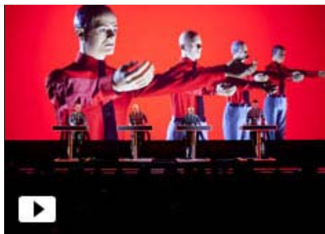
Kraftwerk - descargar vídeo

SonarKids regresa a Barcelona esta Navidad , los próximos 22 y 23 de diciembre , con una propuesta para niños y padres de esculturas sonoras interactivas en la gran rampa helicoidal de CosmoCaixa.