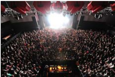
SonarSound Tokyo - descargar

Sónar colabora de nuevo con Design Indaba , la gran plataforma multidisciplinar que transforma Ciudad del Cabo en capital mundial de la creatividad y la innovación. La cita cuenta cada año con la presencia de los más importantes emprendedores y ponentes del mundo, que presentan proyectos en el campo de la arquitectura, el diseño, el cine y la música, entre otros.