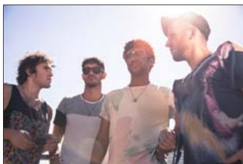
Hot Natured - descargar