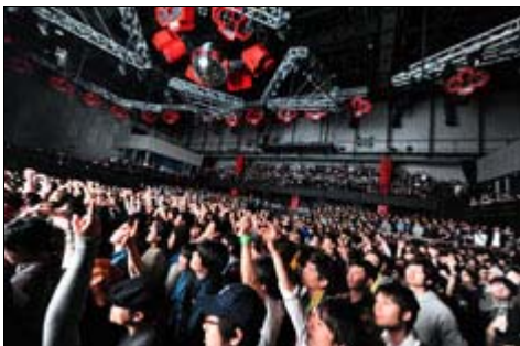
SonarSound Tokyo - descargar

La 6ª edición de SonarSound Tokyo se celebrará los días 6 y 7 de abril . El Sónar asiático contará con una programación de corte eminentemente experimental que combina importantes artistas internacionales y los más destacados representantes del panorama electrónico nipón.