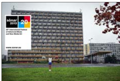
Imagen Sónar 2013 - descargar

El 20º aniversario de Sónar será una celebración global que arrancará en febrero de 2013 en Reykjavik y culminará en junio en Barcelona , pasando por África, Asia y Latinoamérica . En total, Sónar programará el próximo año cerca de 300 actuaciones repartidas en 21 escenarios en sus 5 festivales.