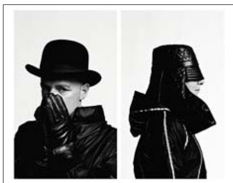
Pet Shop Boys - descargar

También son un referente indiscutible -en este caso en el terreno del pop electrónico- el dúo británico Pet Shop Boys . Tras la reciente publicación de su último disco "Elysium", Neil Tennant y Chris Lowe , quienes se unieron a principios de los 80, presentarán en Sónar Barcelona un nuevo espectáculo de elementos visuales y contenidos tecnológicos . Creadores de un sinfín de canciones míticas de nuestro tiempo como "West End Girls", "Domino Dancing", "It's A Sin", "Go West", "Being Boring" o "New York City Boy", Pet Shop Boys siempre han ido un paso por delante de sus contemporáneos, navegando con inteligencia entre las aguas del pop electrónico y la música de baile manteniendo un admirable y equilibrado éxito tanto crítico como comercial