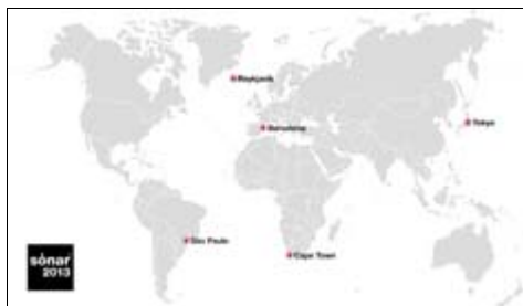
Sónar 2013 en el mundo - descargar

Boys , dos clásicos en plena vigencia y de influencia transgeneracional que han impreso su influencia en la música popular de las últimas décadas, tanto en la electrónica purista como en la música de baile y el pop.