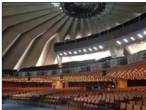
Sónar São Paulo