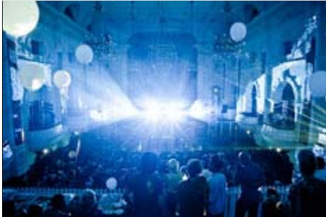
Sónar @ Design Indaba

El edificio que albergará el primer Sónar Reykjavik acoge a la Iceland Symphony Orchestra y a The Icelandic Opera y está diseñado por Henning Larsen Architects en colaboración con el célebre artista Olafur Eliasson.