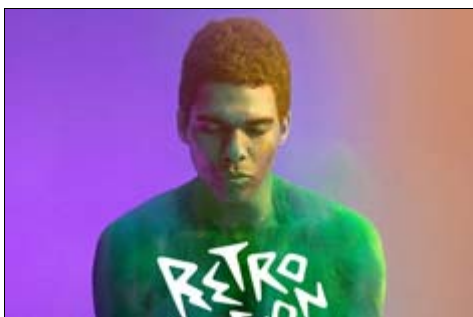
Retro Stefson - descargar

En su primera excursión nórdica Sónar adoptará un formato reducido e íntimo , ejemplo de cómo una marca de prestigio y largo recorrido puede redefinirse a sí misma en localizaciones y recintos más pequeños. Cada velada comenzará a las 18.00 horas y se extenderá hasta las 03:00 horas de la madrugada. La programación incluirá en torno a 15 artistas internacionales y 30 islandeses que