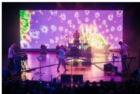
Sónar São Paulo