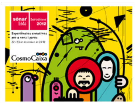
Imagen SonarKids 2012 - descargar

Londres (2002, 2003, 2004, 2005, 2009, 2010 y 2011) / Lisboa (2002) / Neuchatel (2002) / Hamburgo (2002, 2003, 2004, 2005 y 2006) / Tokio (2002, 2004, 2006, 2011, 2012 y 2013) / Roma (2003) / São Paulo (2004, 2012 y 2013) / Lyon (2004) / Guadalajara (2004) / Buenos Aires (2006) / Seúl (2006) / Frankfurt (2007) / Washington (2009) / Nueva York (2009) / Chicago (2010 y 2012) / Ciudad del Cabo (2012 y 2013) / Sónar North American Tour: Chicago, Toronto, Montreal, Boston, Denver, Oakland y Los Ángeles (2012) / Reykjavik (2013).